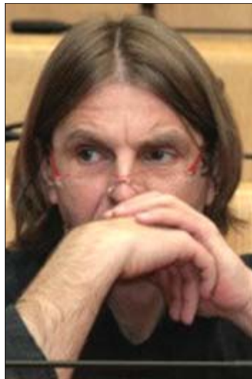
Kojović: Nemamo podataka