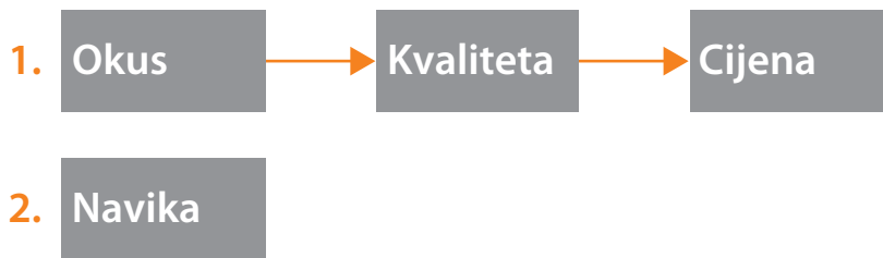
Slika 2. Kako ste danas odabrali svoj brand?

istraživanje unaprijediti na višu razinu. Isto tako, nastojimo rezultate istraživanja učiniti korisnima u nekoliko dimenzija.